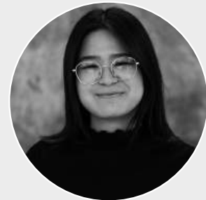
pattaranit tasunan reinzeichnung grafik | 3d

auja: korrekte abstände im text och nö: spinnen